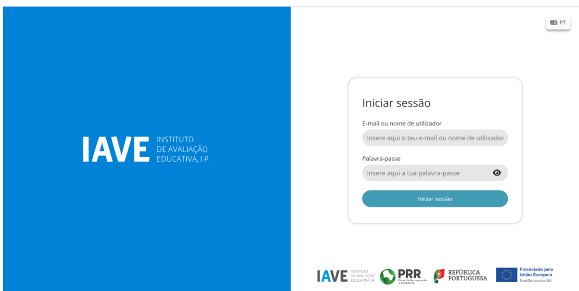
Figura 1 – Acesso à Plataforma de Realização das Provas Eletrónicas do IAVE

(Obs.: Para as escolas que optaram pelo offline em rede ou standalone, os procedimentos para acederem à Plataforma de Realização das Provas Eletrónicas do IAVE irão ser oportunamente divulgados)