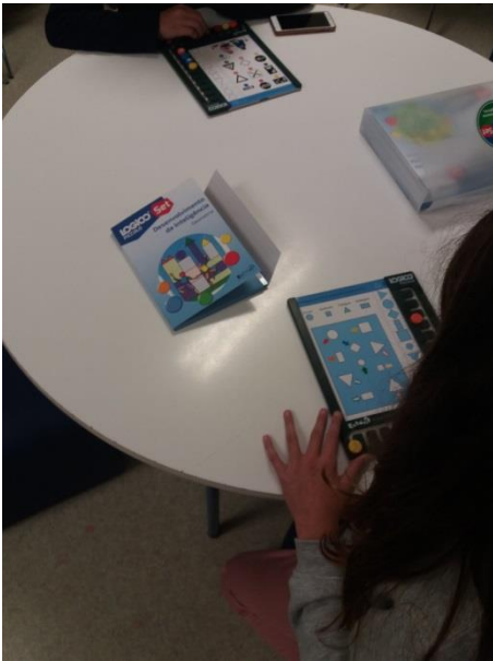
DESENVOLVEMOS A INTELIGÊNCIA...