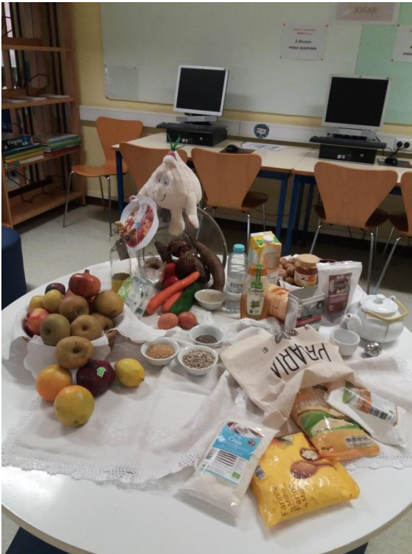
FALÁMOS SOBRE ALIMENTAÇÃO SAUDÁVEL...