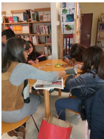
FIZEMOS ESTRELAS DE NATAL EM ORIGAMI...