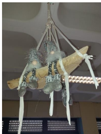
ENFEITÁMOS A BIBLIOTECA...